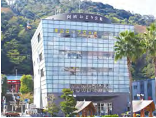
位于眉山山麓的阿波舞会馆。

日本三大祭典之一“阿波舞”。 大家一起成为“癫狂舞者” 摆动身体，放出声音，让心融为一体！