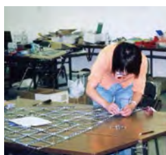
在LED的先进地域，学习LED原理和技术的宝贵体验。