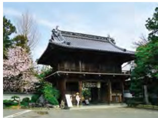
88所以及1460km发愿之寺 “灵山寺”