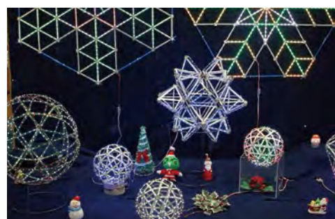
使用了绚烂夺目的LED灯光的原创艺术作品 增进相互间的感性认知，一同体验作品创造的喜悦。