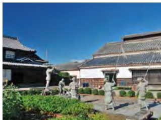
保留蓝商旧宅至今的蓝馆。