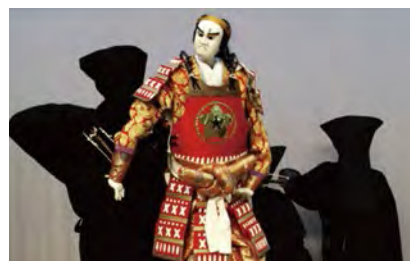
使眼睛嘴巴和五指活动起来赋予人偶表情和生命