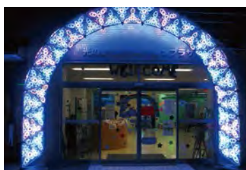
最前沿的LED所聚集的光之城车站广场