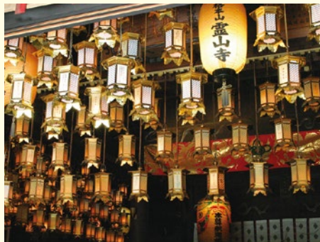
四國遍路發心之地