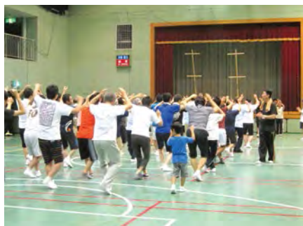
讓我們跟隨歡騰的伴奏,來一起學習阿波舞。