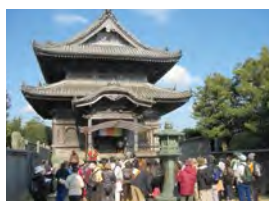
在大師開創的修行之道中與同伴們一齊潛心巡禮,尋找堅韌的勇氣和堅持過後的精彩。