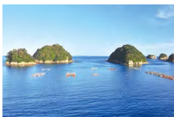
具有美麗里亞斯式海岸的水床灣。