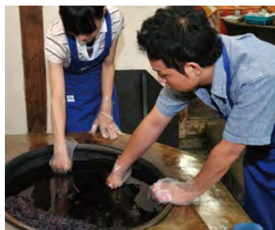
向藍染師學習紮染技藝。

每次進行藍染時，顏色都是逐漸加深的。“淡藍色”“綠色”有“留紺”等48種被命名的顏色。