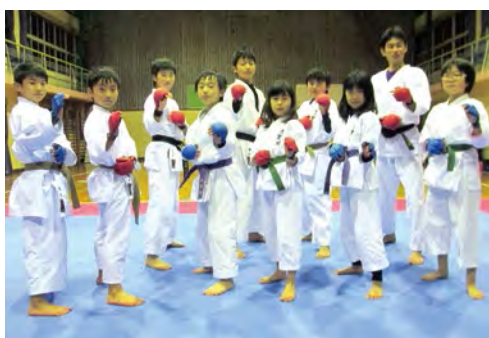
掌握空手道技能的同時，還掌握了禮節、勇氣、耐力、內省、克己、利人、協調性、體貼等社會能力。