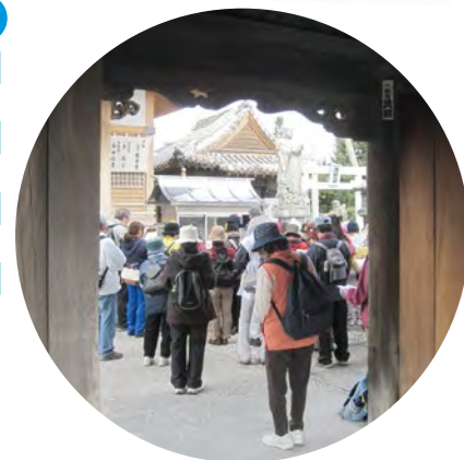
在一步行的道路中,加深團隊的友誼。