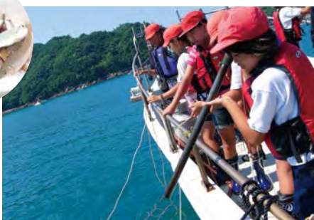
向海面投棒的作業緊張刺激。

在拉上來的網中,可以捕獲從大到小、各式各樣的魚種。透過撒網捕魚,向海上的男子漢們學習捕魚的艱辛和樂趣。