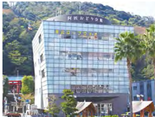
位於眉山山麓的阿波舞會館。

日本三大祭典之一“阿波舞”。 大家一起成為“癡狂舞者” 擺動身體,釋放聲音,讓彼此的心融為一體!