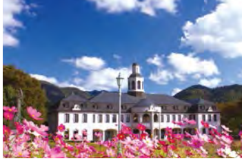
在鳴門市德國館舉辦各式各樣的音樂會。