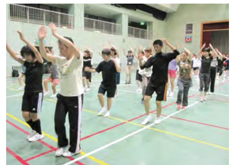
本連成員到齊後,開始演講。