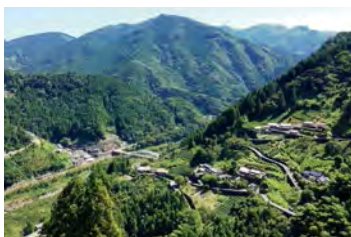
依然保存日本原始風貌的空之鄉